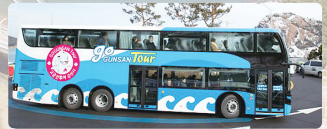
지상항 구조, 휠체어 탑승지역 위편, 경시편, 1층 12석, 2층 59석, 휠체어 2대(총 73석)