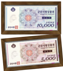
문의 군산시청 지역경제과 063-454-2664

9월 3일부터 본격 시중 유통 「군산사랑상품권」 발매 기념 10% 할인 한정 판매!! (소진 시 까지)