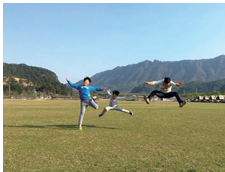
장려상 시뮬되고 하키키