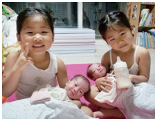
우수상 쌍둥이의 쌍둥이 돌보기