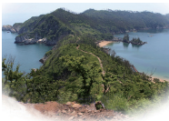
어청도 전경(해에서 바라본 한반도 지형)