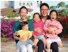
장려상 웃음이 가득한 우리가족