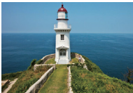
어청도 등대(등록문화재 제378호)