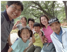
장려상 웃음꽃 가득한 할명유원