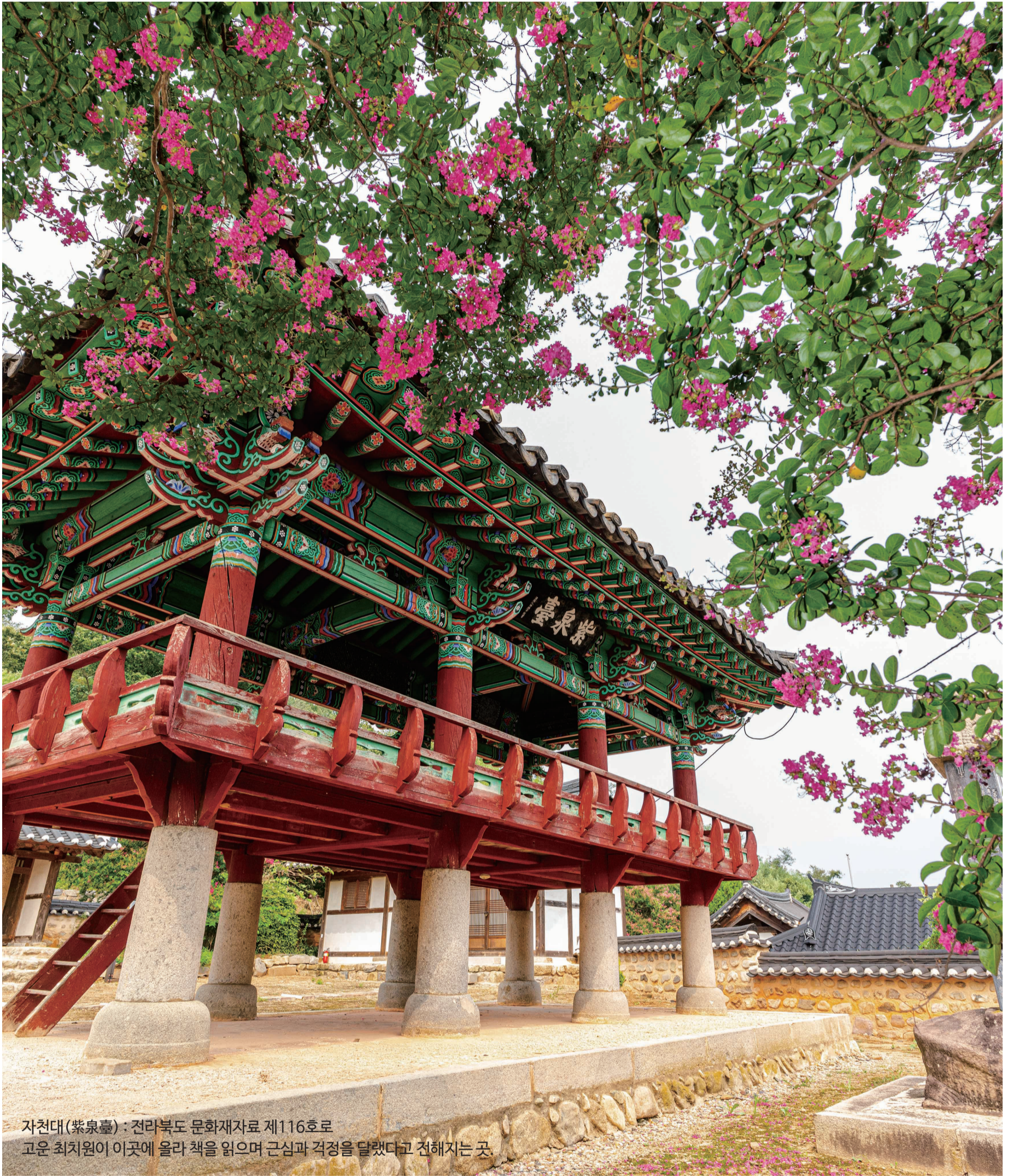
자천대(紫泉臺) : 전라북도 문화재자료 제116호로 고운 최치원이 이곳에 올라 책을 읽으며 근심과 걱정을 달랬다고 전해지는 곳.