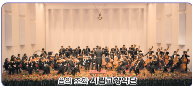
음악의 조화 시립교향악단

풍요와 화합을 바탕으로 고품격 문화를 즐길 수 있는 찾아가는 문화예술 공연은 시민과 함께 하기에 더욱 풍성해 질 수 있습니다. 뜨거운 스포츠 열기는 군산시민들의 마음을 하나로 묶고 감동을 주었습니다. 2010년 군산은 함께 더불어 살 수 있는 도시, 질서와 문화, 환경이 어우러진 품격있는 도시를 지향합니다.