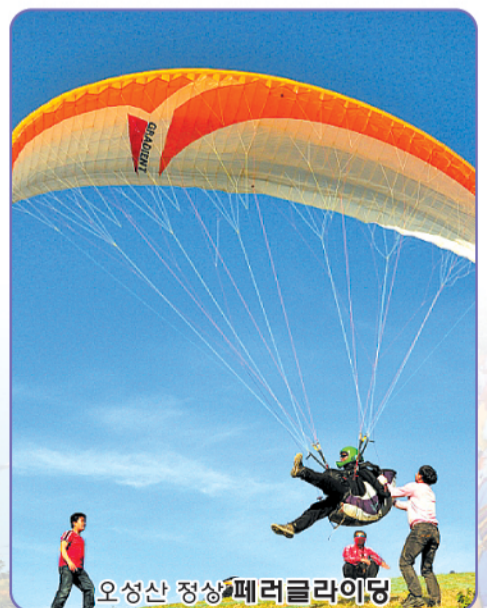
오성산 정상 페러글라이딩