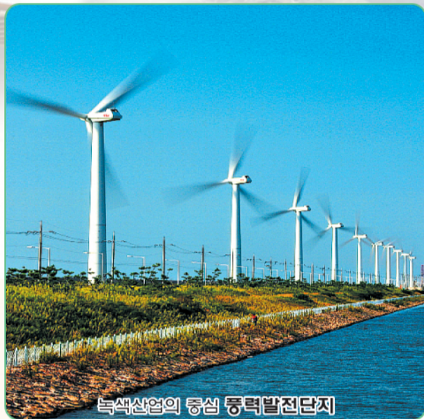
녹색산업의 중심 동력발전단지

군산은 오늘도 쉬지 않고 뛩니다. 오늘처럼 내일도 끊임없이 성장할 미래경쟁력의 도시 저탄소 친환경 경제성장을 이끄는 녹색성장의 메카로 도약합니다.