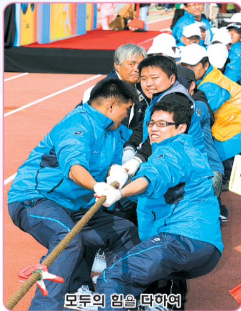
모두의 힘을 모아

풍요로움을 추구 하면서 계층간, 빈부간 갈등이 없이 화합하는 도시를 구현합니다. 시민화합과 지역발전을 위해 사회적 약자를 배려하는 풍토가 자리잡을 수 있도록 시민과 함께 화합을 일구며 따뜻한 지역사회 만들기에 한 몫을 하고 있습니다.