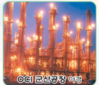
OCI 군산공장 야경