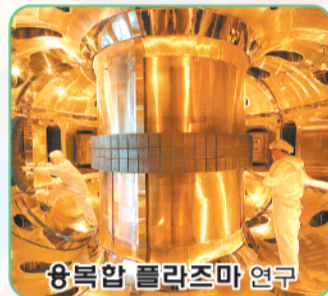
융복합 플라즈마 연구