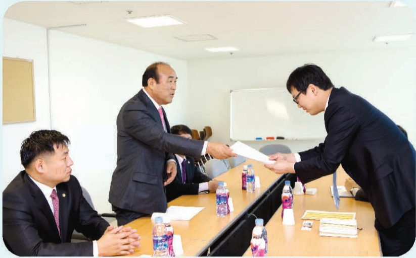
롯데마트·이마트 군산점에 영업시간 단축 촉구문 전달

군산시의회가 대형자본을 앞세운 대형마트 시장 잠식으로 고통받고 있는 전통시장과 소상공인들의 생존권 보호를 위해 적극 나섰다.