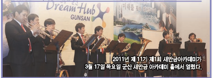
2011년 제 11기 제1회 새만금아카데미가 3월 17일 목요일 군산 새만금 아카데미 홀에서 열렸다.