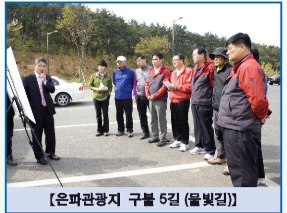
【은파관광지 구불 5길 (물빛길)】