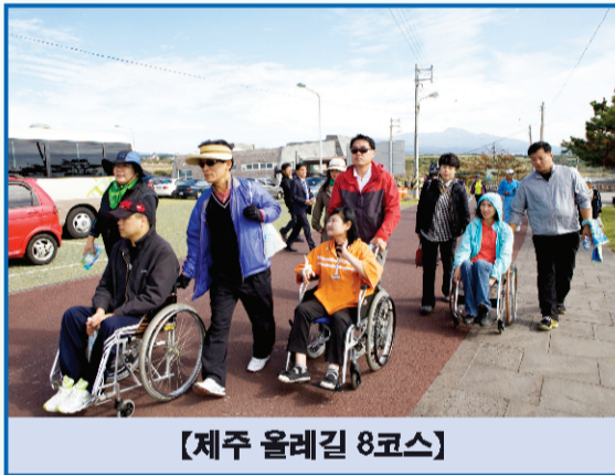
【제주 올레길 8코스】

▶ 현장방문 : 제151회 임시회 기간인 10월 12일부터 2일간 은파관광지 일원의 구불 5길(물빛길)과 근대 역사 경관조성 등 4곳의 현장을 방문했다. 이 자리에서 행복위는 구도심권이 관광산업으로 활기를 되찾을 수 있는 계기가 되기를 바란다고 말했다.