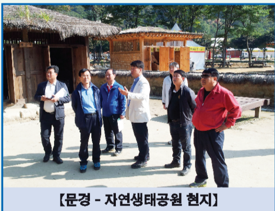
【문경 - 자연생태공원 현지】