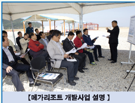
【메가리조트 개발사업 설명】