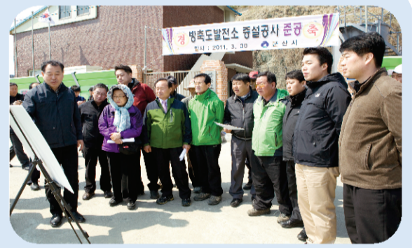
경제건설위원회- 방축도발전소 증설공사 현장

“현장에 가면 답이 있다”는 생각으로 금년 한해는 시민의 손과 발이 되고자 현장중심의 의정활동을 충실히 펼쳐왔다. 특히 지난 7월에는 군산지역에 큰 폭우로 농경지 침수와 산사태 등 피해지역을 일일이 점검했으며, 신속한 대책 마련에 총력을 기울였다. 또 주요업무 보고와 안전심사 과정에서 드러난 현안사업에 대해 일일이 현장을 점검하는 등 지난 1년간 44곳의 현장방문을 실시 했다.