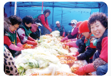
회현면 (회현농협 육모장)