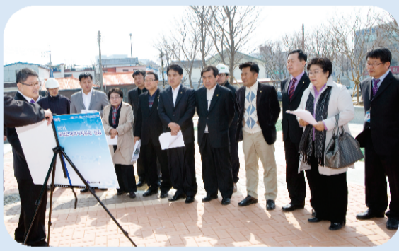
행정복지위원회- 근대역사박물관 신축 현장