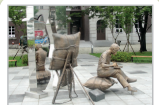
근대건축관 외부 조형물