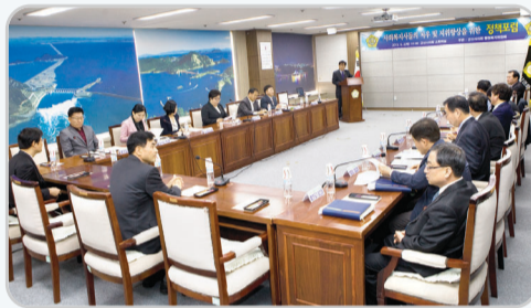
▲ 사회복지사 권익 신장을 위한 정책포럼