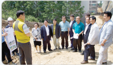
▲ 재해재난 복구 현장