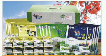
- 주 생산품 - 재래전장김, 참뽕잎도시락김 등 조미김