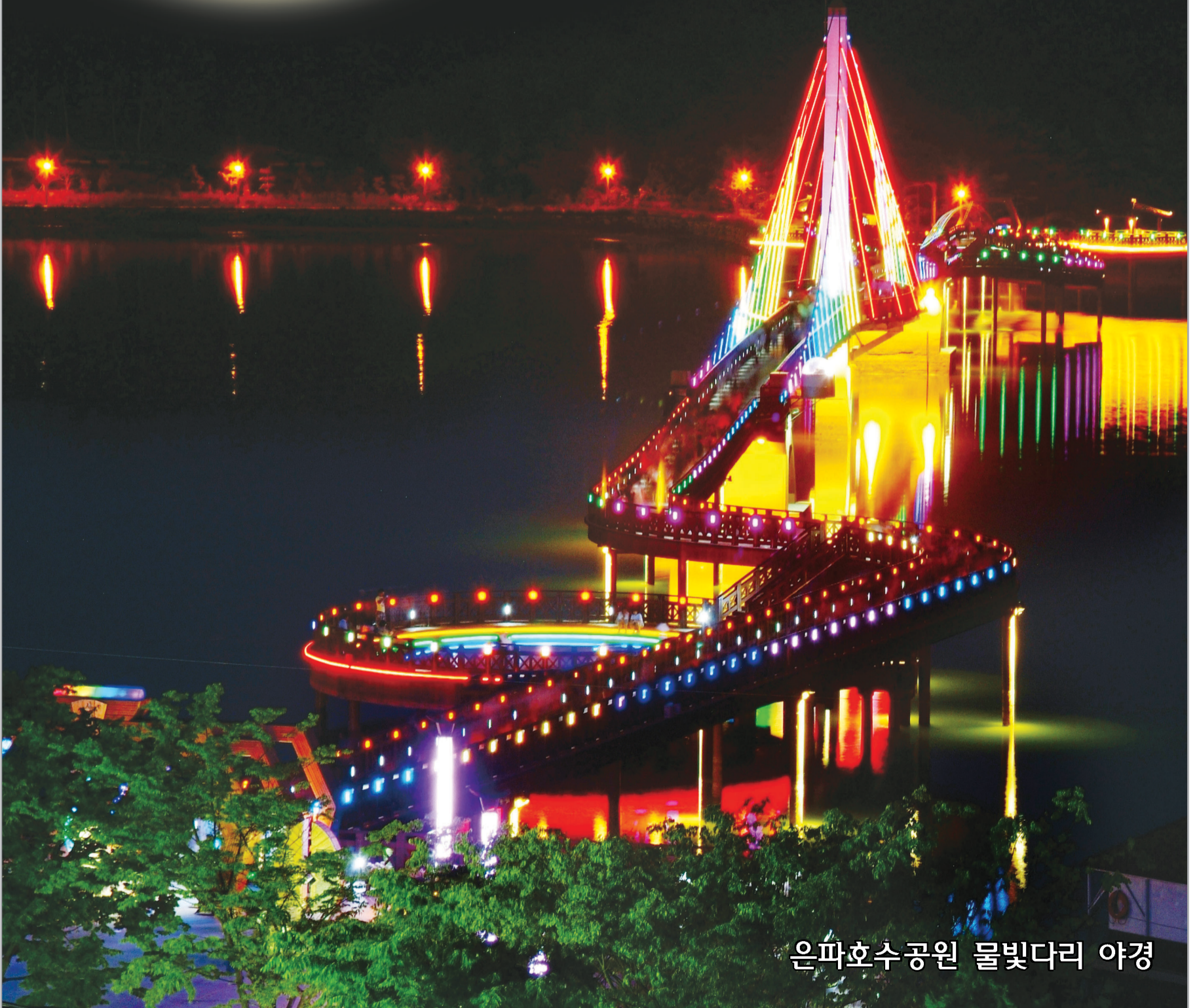
은파호수공원 물빛다리 야경