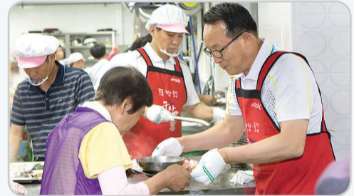
▲ 군산경로식당 봉사활동