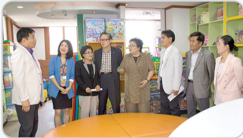
▲ 지역아동센터 방문