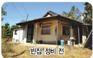
빈집 정비 전

군산시가 농어촌의 열악한 주거환경을 개선해 살기 좋은 농어촌 마을을 가꾸기 위한 노후 빈집 정비사업을 실시하고 있다.