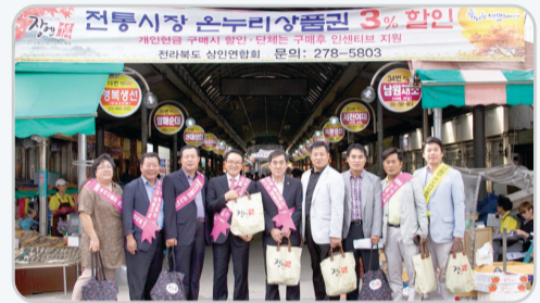
▲ 재래시장 장보기