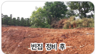
빈집 정비 후

시는 올초 빈집 철거 희망자 신청접수를 받아, 농촌마을 경관 저해도, 환경 위해성, 건물 노후도 등을 우선 정비대상 선정기준으로 설정, 총 60동을 선정해 정비 중에 있다.