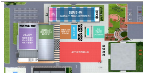
▲ 개막식 위치