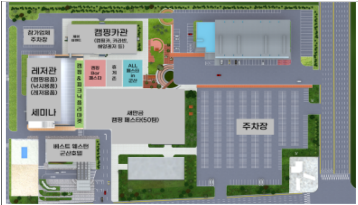
전체 행사장 구성(안)