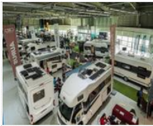
▲ 캠핑카, 카라반