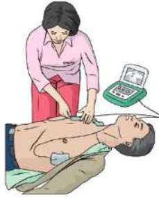
② 두 개의 패드 부착