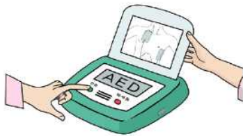
① 전원을 켜다