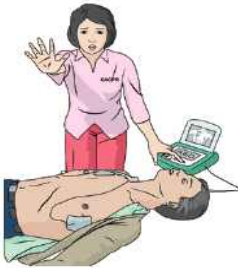
④ 심장충격 시행