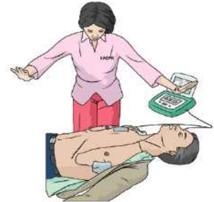
③ 심장리듬 분석