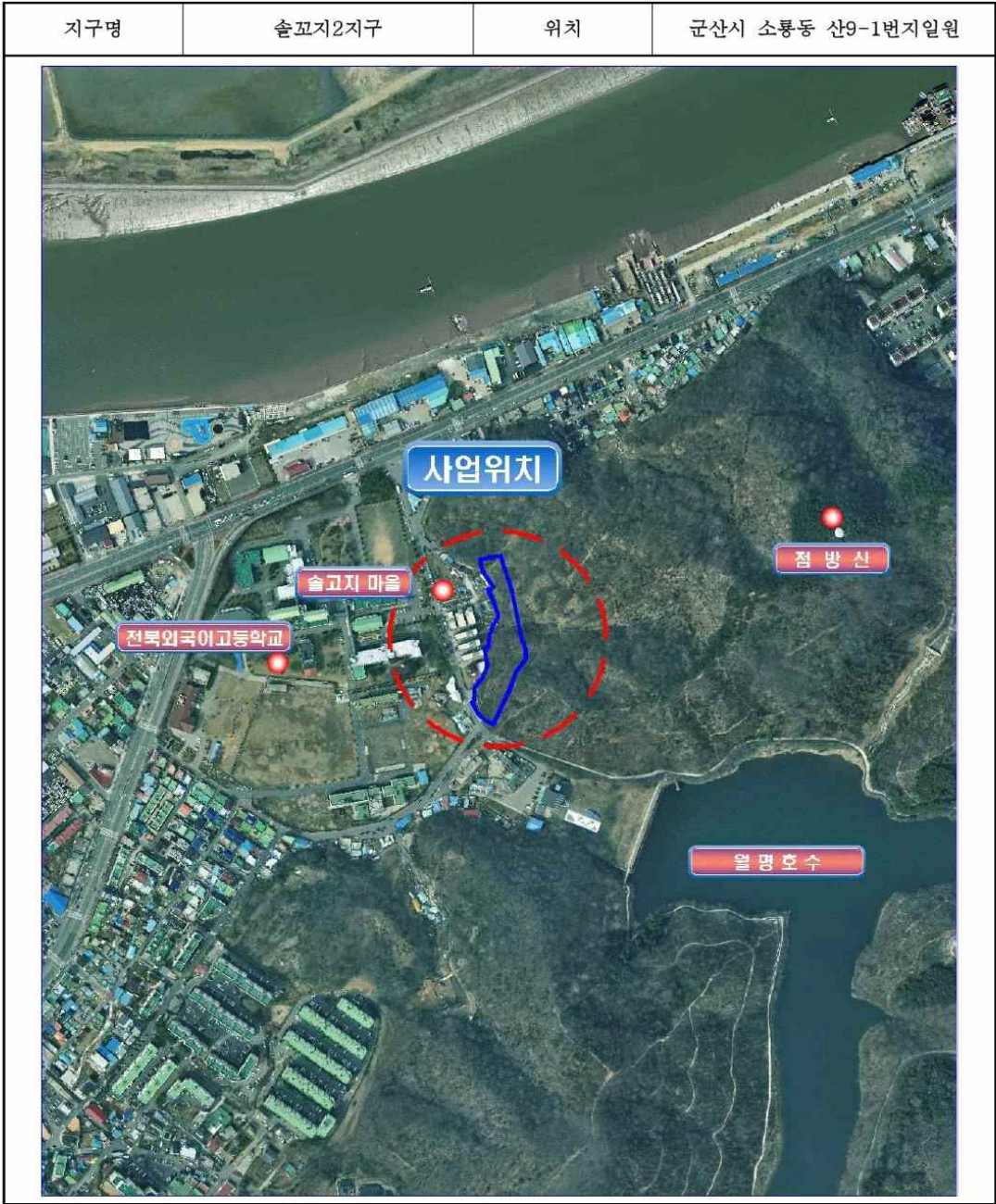
「붙임1」 급경사지 붕괴위험지역 위치도