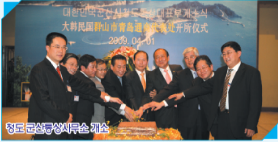
청도 군산통상사무소 개소

- 청도 군산통상사무소 개소, 군산-강음시 우호협력 교류도시 협약체결등 -