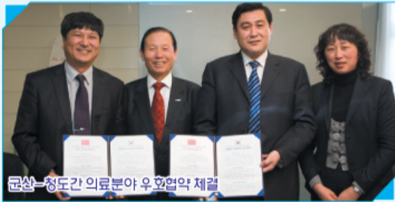
군산-청도간 의료분야 우호협약 체결

또한 중국 양자강 삼각주의 천혜의 물류항을 보유한 강소성 강음시를 방문하여 향후 항로개척 및 관광객 상호교류, 학생 수학여행단 구성, 새만금 방조제 걷기 등에 관한 협력을 위한 우호 협력교류도시 협약 체결식을 갖었으며 양주시를 방문 삼국시대 학자이자 성인인 최치원 선생의 기념관을 둘러보고 최치원 선생이 학문에 정진했던 군산 신시도 지역과 연계한 상호 방문단 구성 학사탐구 및 관광객을 구성 교류하는 방안을 협의 하였고 마지막 일정으로 북경을 방문하여 중국 만리장성과 군산새만금 걷기프로젝트 추진에 적극 협조하기로 하였으며 북경 현지에서도 충분한 가능성을 제시하고 내년부터 적극 추진하기로 하여 이번 방문은 경제적 교류뿐만 아니라 의료, 문화분야 등 다양한 협의가 이루어져 향후 성과가 기대되고 있다.