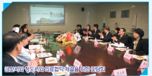
군산시와 청도시와 의료협약체결을 위한 긴급회의