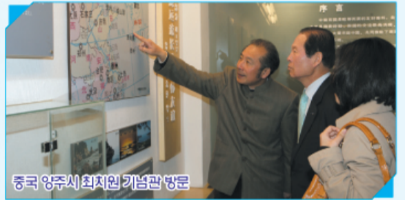
중국 양주시 최치원 기념관 방문

또한 중국 양자강 삼각주의 천혜의 물류항을 보유한 강소성 강음시를 방문하여 향후 항로개척 및 관광객 상호교류, 학생 수학여행단 구성, 새만금 방조제 걷기 등에 관한 협력을 위한 우호 협력교류도시 협약 체결식을 갖었으며 양주시를 방문 삼국시대 학자이자 성인인 최치원 선생의 기념관을 둘러보고 최치원 선생이 학문에 정진했던 군산 신시도 지역과 연계한 상호 방문단 구성 학사탐구 및 관광객을 구성 교류하는 방안을 협의 하였고 마지막 일정으로 북경을 방문하여 중국 만리장성과 군산새만금 걷기프로젝트 추진에 적극 협조하기로 하였으며 북경 현지에서도 충분한 가능성을 제시하고 내년부터 적극 추진하기로 하여 이번 방문은 경제적 교류뿐만 아니라 의료, 문화분야 등 다양한 협의가 이루어져 향후 성과가 기대되고 있다.