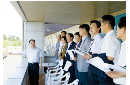
경제건설위원회 전국 대학생 자작차 경주장 현황 청취