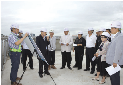
행정복지위원회 군산시립박물관 신축 현황 청취