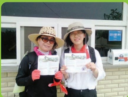
도보여행 스탬프 투어 옥산저수지 구슬뒀길

☎관광진흥과 450-6110, http://cafe.daum.net/gubulgil