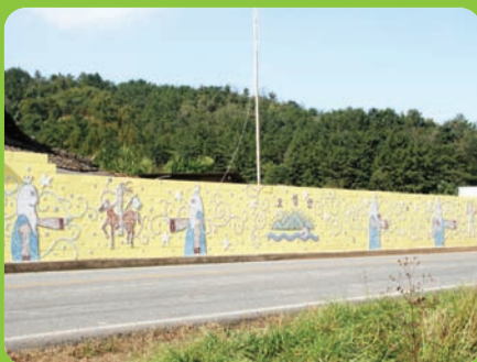
설화, 지명유래, 역사 등 활용한 스토리텔링 미술프로젝트 비단강길