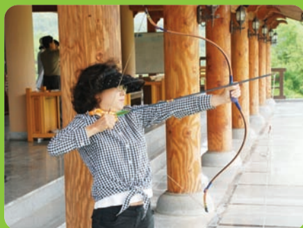
지역주민 민박운영 및 체험프로그램운영 진남정 국궁체험 큰들길