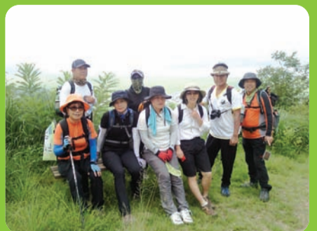
매주 수요일·토요일 도보 프로그램 운영 나포십자들과 금강 배경으로 한 햇빛길