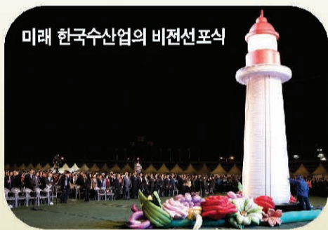
미래 한국수산업의 비전선포식

제8회 한국수산업경영인대회가 지난 5월 11일~13일까지 새만금의 도시 군산에서 열렸다. 이번 대회는 전국 8,000여명의 수산인들이 한자리에 모여 세계일류 한국수산을 이룩하는데 앞장설 것을 다짐하고 어촌경제 회생에 중추적인 역할을 발휘할 수 있도록 수산업경영인들의 자긍심을 높였다.